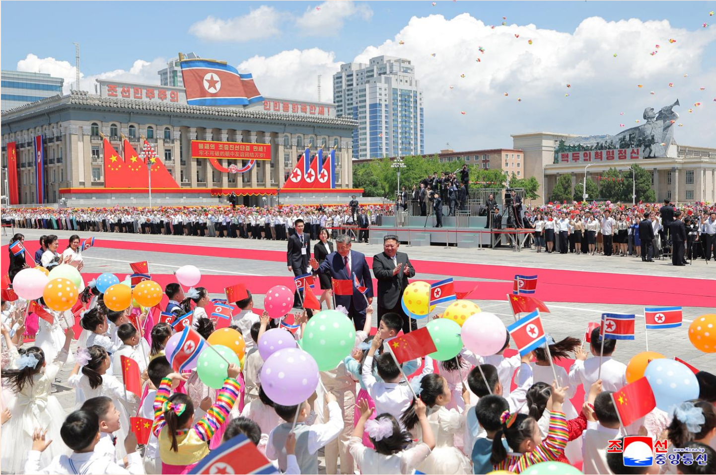
(朝中社平壤 2026年6月9日电)